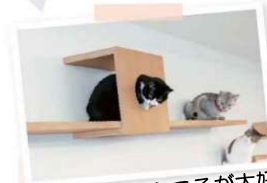
居心地のいいところが大好き