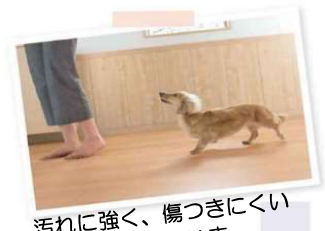
汚れに強く、傷つきにくい ペットが滑らない床