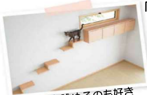
外を眺めるのも好き

「家族」の一員であるペットのために、「好き！」が詰まった家を創りましょう。ご要望に沿ったプランや製品をご紹介します。