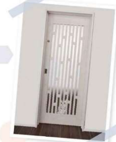
飛び出しを防ぎたい