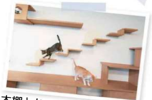
本棚とねこ階段を兼用